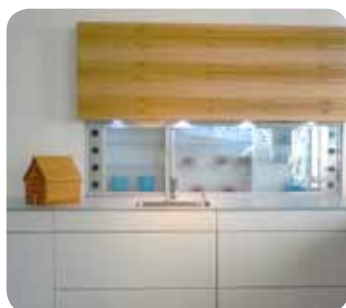
Reduziertes Design in der Küche, fast zu schön zum Anfassen. Gesehen bei Magniküche