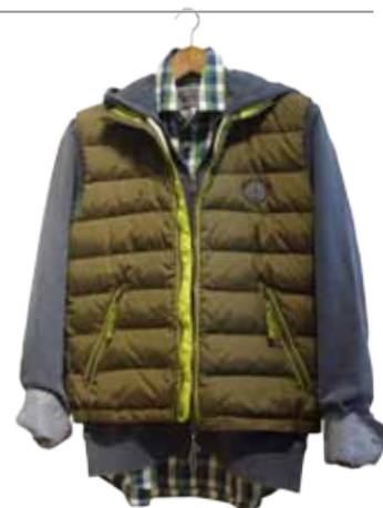
Daunenwesten sind sportlich und wärmen an den ersten kühleren Tagen. Gesehen bei Marc O'Polo am Ziegenmarkt