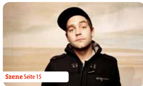
Szene Seite 15