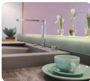
Spülbecken mit Industriecharme sind robust und stylish. Gesehen bei Magniküche