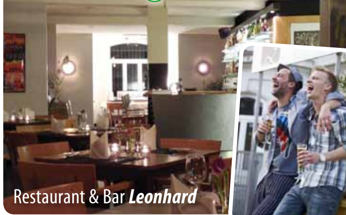
Restaurant & Bar Leonhard