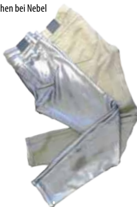
Wendehose aus Velours. Gesehen bei Nebel