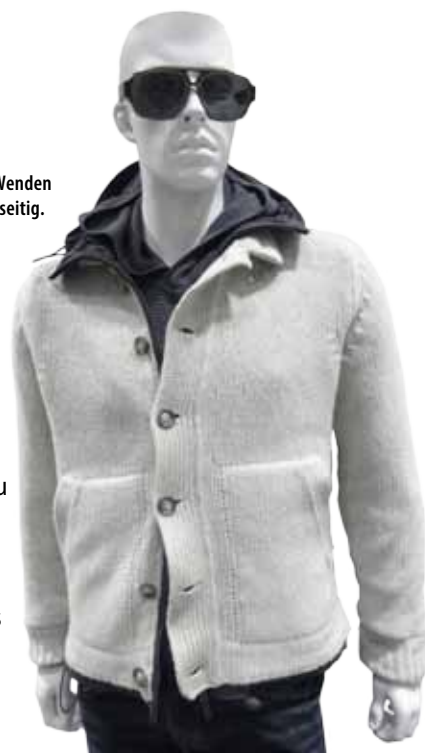
Die Strickjacke zum Wenden ist praktisch und vielseitig. Gesehen bei Nebel

Vorbei sind die Zeiten, in denen Männer im Winter Schwarz und ist das neue Schwarz und die neuen Rot- und Currytöne passen neuen Männertrend. Von den Materialien her bleibt es klassisch: Grobstrick und Wolle, Cashmere und Flanell. Karomuster sind wieder salonfähig und Chinohosen können auch im Herbst noch getragen werden. Der College-Style ist in dieser Saison ein großes Thema, deshalb dürfen Sweatshirts über dem Hemd getragen werden, und Daunenwesten schützen an den ersten kalten Tagen. Als Hingucker greifen stilbewusste Männer in diesem Herbst zu Stiefeletten, zum Beispiel mit Kautschuksohle oder im Budapesterstil. Mutige krepeln die Chinohosen hoch und zeigen den Schaft, die neuen Stiefeletten machen sich aber auch unter dem Hosenbein sehr gut.