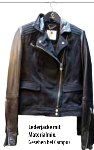
Lederjacke mit Materialmix. Gesehen bei Campus

Eigentlich sind sie nie weg gewesen und doch feiern sie in diesem Herbst ein Comeback. Lederjacken in unterschiedlichen Farben und Strukturen, mit Materialmix, Beschichtungen oder aufwendigen Applikationen glänzen, so weit das Auge reicht. Dabei ist für jeden Geschmack etwas dabei. Kombiniert werden die Klassiker mit den neuen Farben wie Grün und Beertönen in unterschiedlichen Nuancen. Krawattenmuster und Norweger-Prints tauchen auf Pullovern und Hosen auf, und neben Schwarz, Grau, Grün und Blau ist Brombeere die Farbe des Herbstes. Aufregende Akzente setzen Metallicbeschichtungen und Neonfarben.