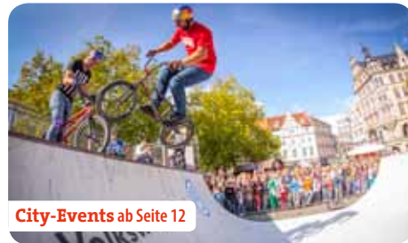
City-Events ab Seite 12