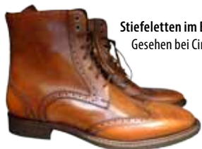
Stiefeletten im Budapesterstil. Gesehen bei Cinque