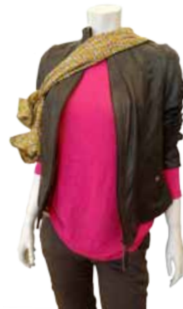
Leder kombiniert zu Pink. Gesehen bei Summersby

Die Kontaktdaten dieser und weiterer Geschäfte finden Sie unter: www.braunschweig.de/einkaufsfuehrer