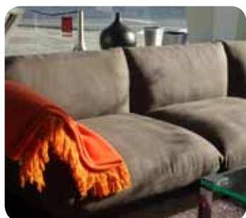
Liegewiese in Taupe mit orangefarbenen Accessoires. Gesehen bei Wohndesign

Die Kontaktdaten dieser und weiterer Geschäfte finden Sie unter: www.braunschweig.de/einkaufsfuehrer