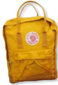
Das Raumwunder von Fjällräven ist ein Kultobjekt und jetzt in neuen Herbstfarben erhältlich. Gesehen bei Auf und Davon