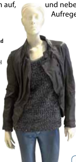
Metallic-Hose und Glitzerpullover in Blautönen. Gesehen bei Nebel