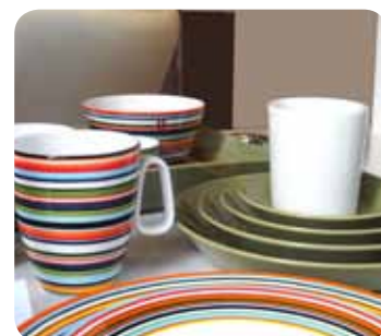
Herbstfarben in der Küche – mit buntem Geschirr namhafter Hersteller. Gesehen bei Körner