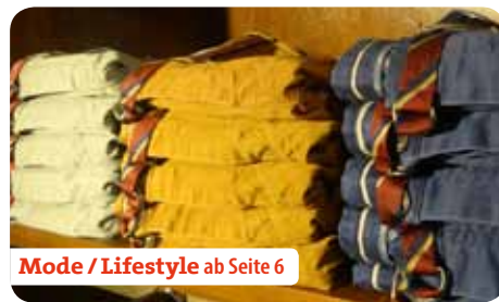
Mode / Lifestyle ab Seite 6

Steigenberger Parkhotel / Besonderer Service im Einzelhandel