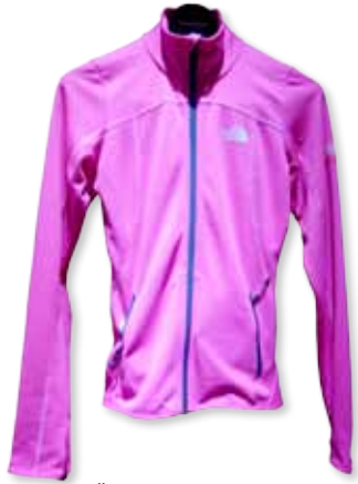
Übergangsjacke von The North Face. Gesehen bei SportScheck