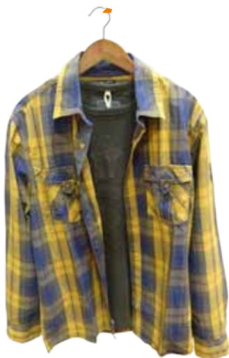
Karos und Ringelstreifen sind ausdrücklich erlaubt. Gesehen bei Campus