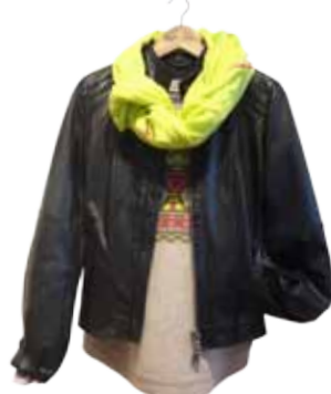
Lederjacke zu Norwegerpullover und Neonakzent. Gesehen bei Marc O' Polo am Ziegenmarkt