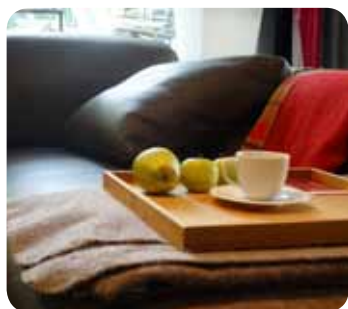
Vielseitiges Ledersofa mit Herbstdekoration. Gesehen bei Wohndesign