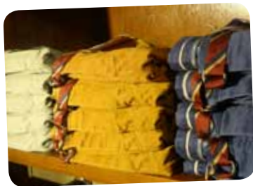
Chinohosen in Herbsttönen. Gesehen bei Campus

Die Kontaktdaten dieser und weiterer Geschäfte finden Sie unter: www.braunschweig.de/einkaufsfuehrer