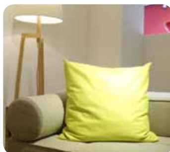
Naturmaterialien und skandinavisches Design erfreuen sich großer Beliebtheit. Gesehen bei Sander