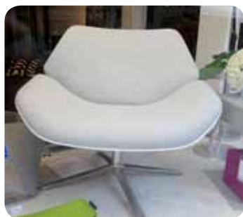
Klubsessel mit Retrocharme in Steingrau. Gesehen bei Körner